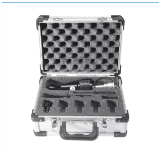
Im Lieferumfang enthalten, der hochwertige Alukoffer