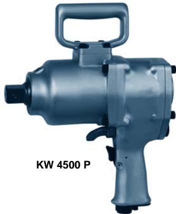
KW 4500 P