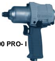
KW 1600 PRO-I

Ein Schlagmechanismus der nächsten Generation.