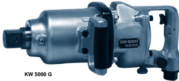
KW 5000 G