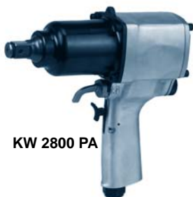
KW 2800 PA