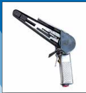
SI - 2800