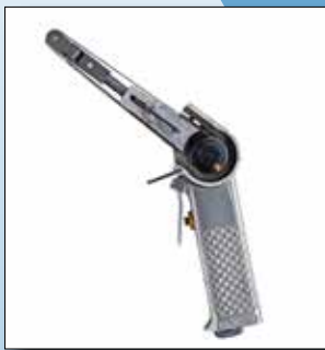
SI - 2700

Unsere Bandschleifer eignen sich auch hervorragend für Entgratungen aller Art und sind eine sinnvolle und wirtschaftliche Ergänzung für alle Schleifarbeiten.