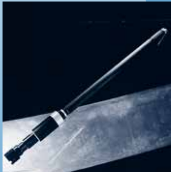
TA-15-530L ist mit einem verlängertem Rohr ausgestattet.